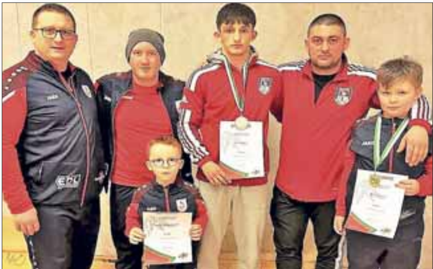
Unsere erfolgreichen Jugendlichen der Landesmeisterschaft