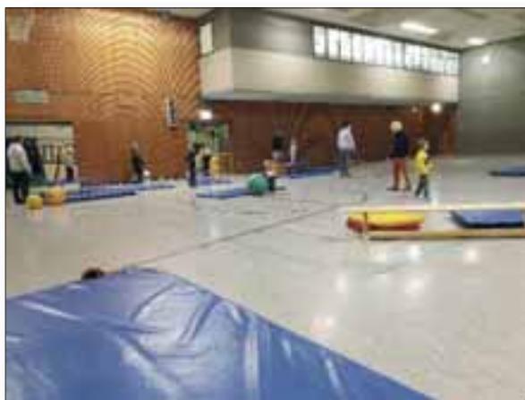
Viele halfen beim Aufbau der Geräte

Liebe Mitglieder*innen der Abteilung Turnen und Ski,