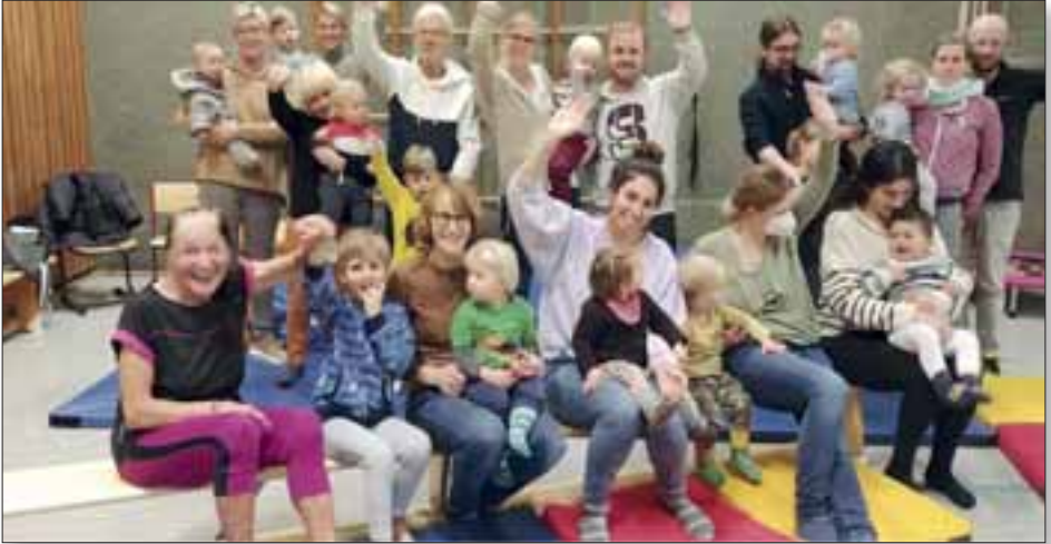
Zum Abschluss gab es dann noch ein Gruppenfoto.

Der Vorstand der Turn-/Skiabteilung hat der Gruppe an diesem Tag auch einen Besuch abgestattet.