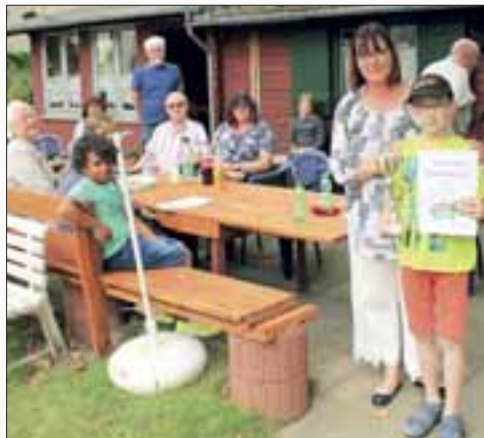
Hier ein Foto aus früheren Jahren (Sieger im Bahnengolf)

Unsere Hauptjugend wird in diesem Jahr wieder aktiv und nach der Versammlung, in Abstimmung mit den Jugendwarten der einzelnen Abteilungen, für 2023 ein Programm überlegen.