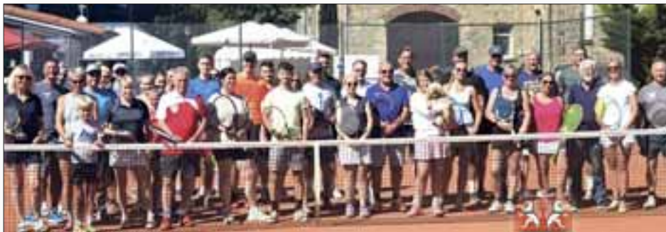
Teilnehmerinnen und Teilnehmer am Schleifchen-Turnier 2022

Schleifchen-Turnier & Saisoneroöffnung am 15.04.2023 SUA-Ostermann-Frühlingscup vom 08.05 bis 13.05.2023