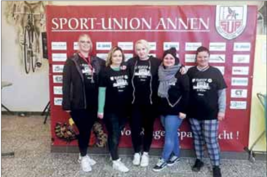
Unser Helferinnenteam in der Fritz-Husemann-Halle