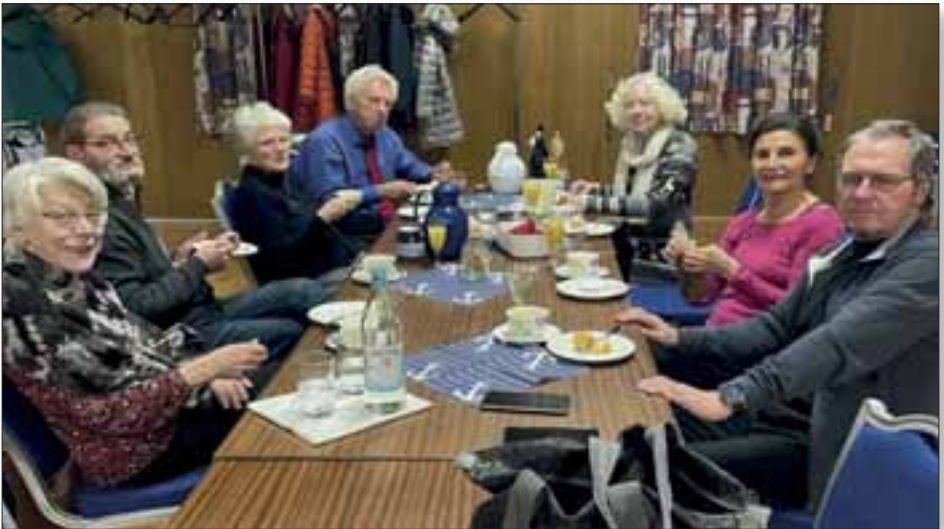
Beide Breitensportpaare feierten nach dem Übungsabend in gemütlicher Runde ihren 70.Geburtstag