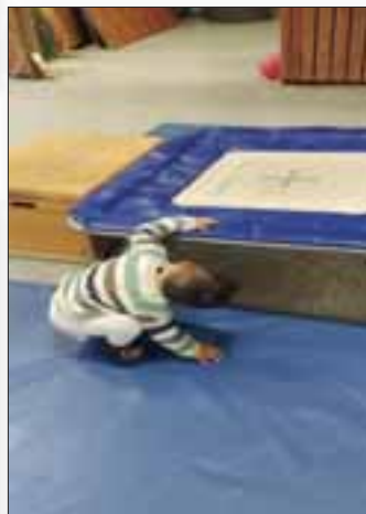
Wollen wir doch mal sehen, ob die alles richtig zusammengebaut haben.